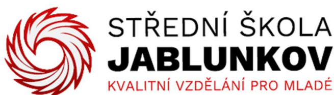
Obr. 4 Logo školy

Obrázky a tabulky menší než půl stránky mohou být zařazeny do textu. Pokud jsou větší, budou zařazeny do příloh. Obrázky se označují titulkem Obr. č. x a popisem obrázku pod obrázkem (viz Obr. 4).